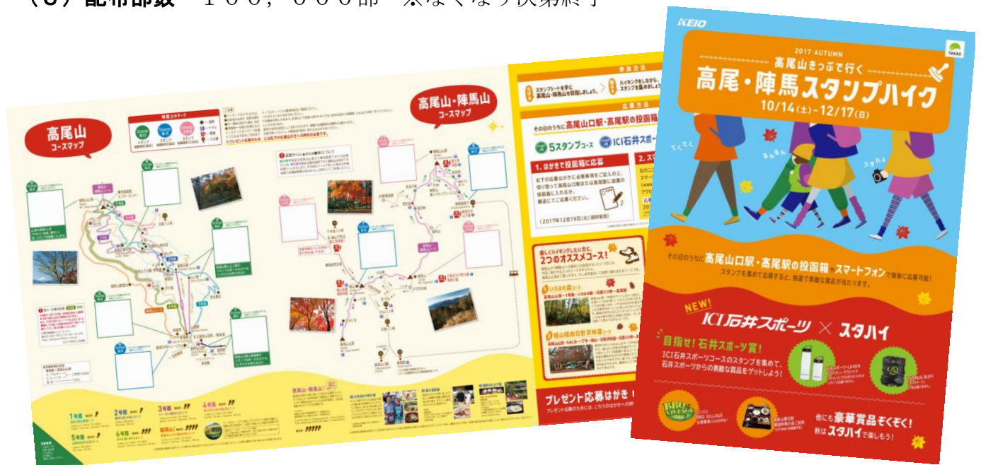
《スタンプハイクコースマップ》