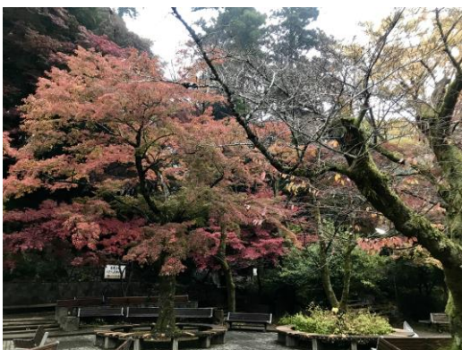
《高尾山の様子（11月14日撮影）》