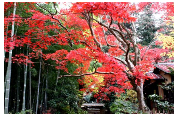
《京王百草園の紅葉と竹》

※京王線新宿駅から約35分(特急・準特急利用、府中駅乗り換え) ※駐車場がありませんので、ご来園の際は電車をご利用ください。 ※ペットの入園はお断りしています。 ※百草園駅から当園までの間、一部急坂の箇所があります。