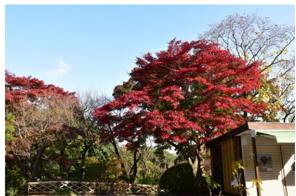
《百草園の様子（11月13日撮影）》