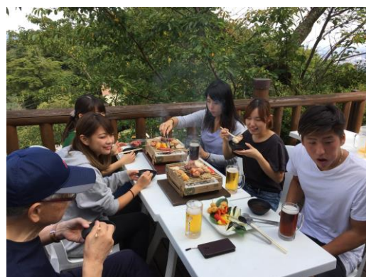
《高尾山BBQマウントの様子》