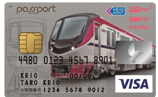
《京王パスポートカード:限定デザイン》

※そのほか、「京王ライナーデビューキャンペーン」として、4月30日までに座席指定券を購入すると、次回ご乗車分の400ポイントをプレゼントします。(お一人様1回)