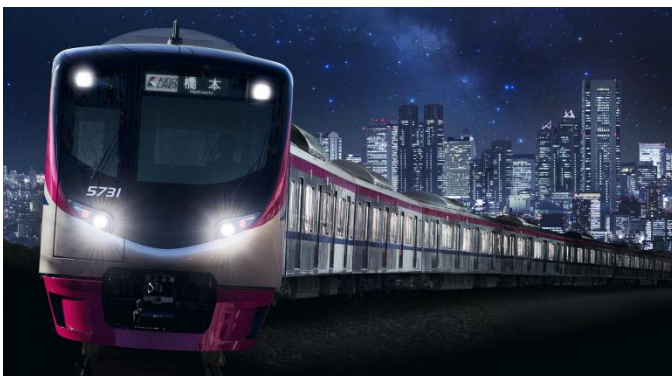
《京王ライナー(5000系車両)》