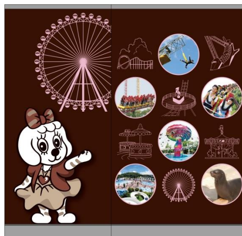
《柱デザインイメージ ⑤グッド ⑥ラッキー》