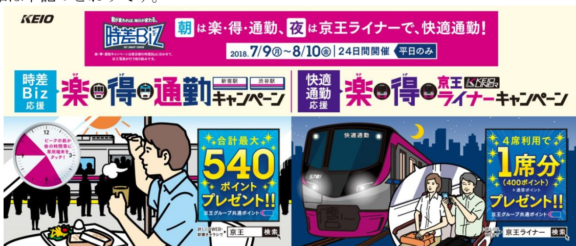
&lt;&lt;キャンペーンPR画像（イメージ）&gt;&gt;