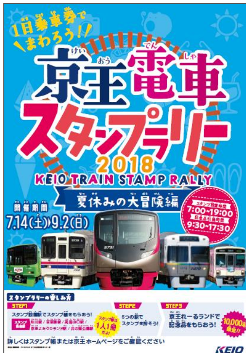
《PRポスターイメージ》