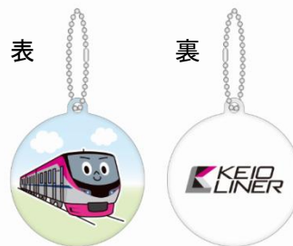
《反射キーホルダー（表裏）》