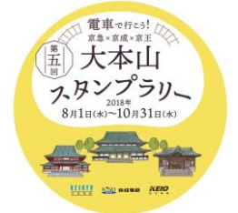
オリジナルヘッドマーク (イメージ)

キャンペーン期間中、各社1編成に大本山スタンプラリーのオリジナルヘッドマークをつけて運行いたします。 ※運行は毎日変わります。