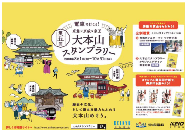
ポスター（イメージ）