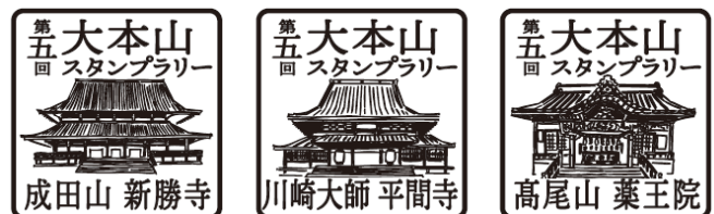
寺院スタンプ（イメージ）