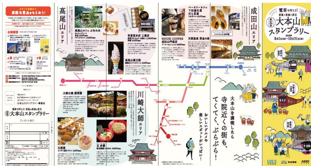
リーフレット (イメージ)