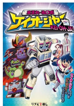
《メインビジュアル(イメージ)》