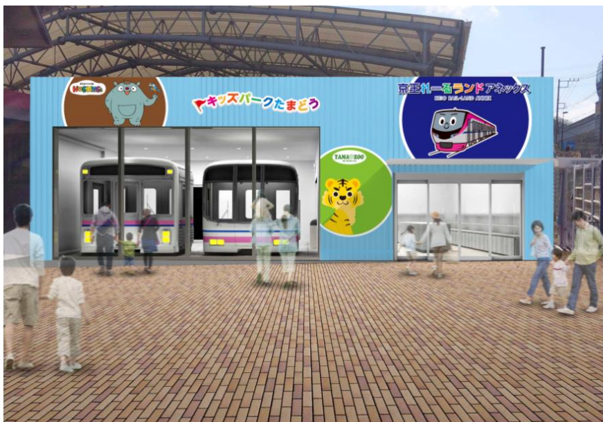
《京王れーるランドアネックス(イメージ)》