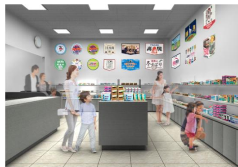
《アネックス内のショップ(イメージ)》

開業5周年を記念した限定商品として、ネクタイ・タイピンセット、新旧5000系車両のICカードケースやキーホルダーなどのコラボセットや、京王ライナー運行開始記念の限定ダイキャストモデルなどグッズ約10点を詰め合わせた福袋を10月13日(土)9:30から発売します。また、京王れーるランドオリジナル商品を大幅に拡充するとともに、京王グッズのほか、京王電鉄バス株式会社や多摩都市モノレール株式会社などの他社のオリジナルグッズも発売します。