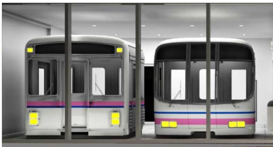
《カットモデル(イメージ)》