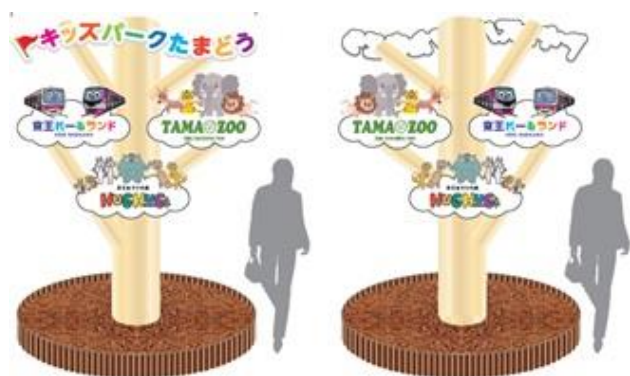
《モニュメント(イメージ) ⑤正面 ⑥背面》

(3) 内 容 京王電鉄キャラクターのけい太くんや、京王あそびの森 HUGHUG<ハグハグ>のキャラクターのハグーとのグリーティング、さらに新たに設置されるモニュメントのお披露目を行います。