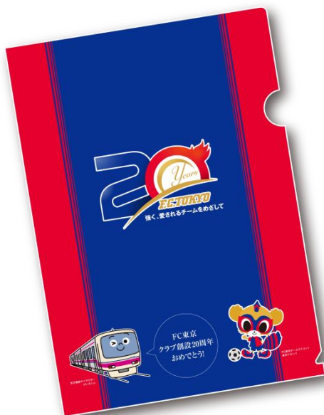
≪オリジナルクリアファイル≫