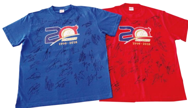
《サイン入り「20周年記念Tシャツ」》