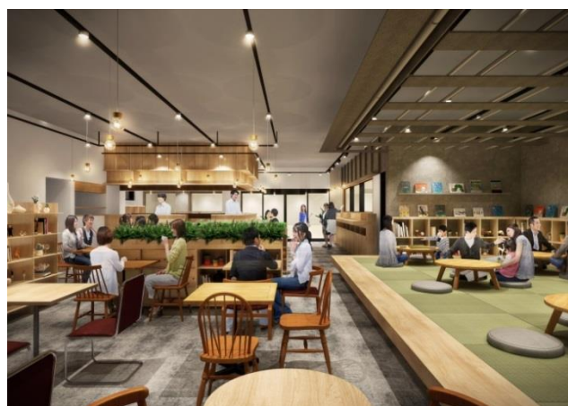
◀ 「武蔵野台商店」(イメージ) 左：店舗入口 右：店舗内 ▶