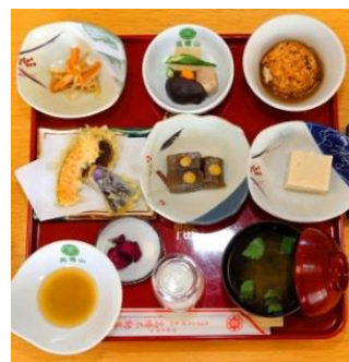
《高幡不動尊精進料理（イメージ）》