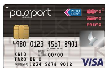
《京王パスポート PASMO カード VISA》