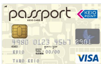
《京王パスポート VISA カード》

京王パスポートカードは、会員数150万人以上を擁する京王グループカードです。ポイントカードとして、現金支払い時のみに京王グループ共通ポイントを付ける「現金専用カード」もあります。