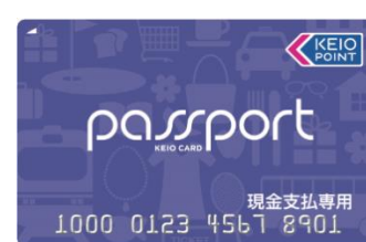
《京王パスポート 現金専用カード》