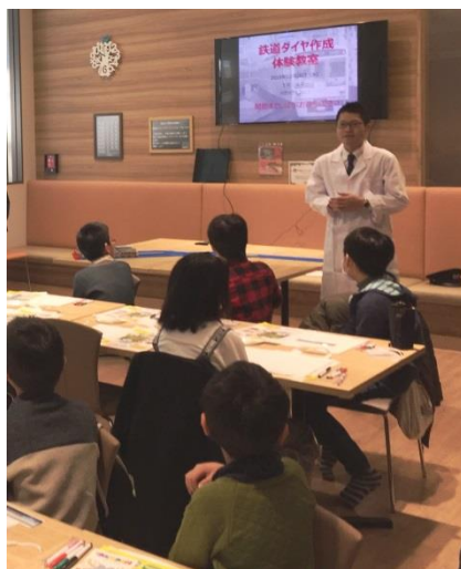
≪前回の「鉄道ダイヤ作成体験教室」の様子≫