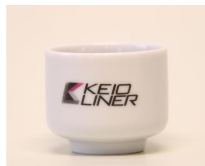
《京王ライナーデザインの記念おちょこ㊤表面㊦裏面》