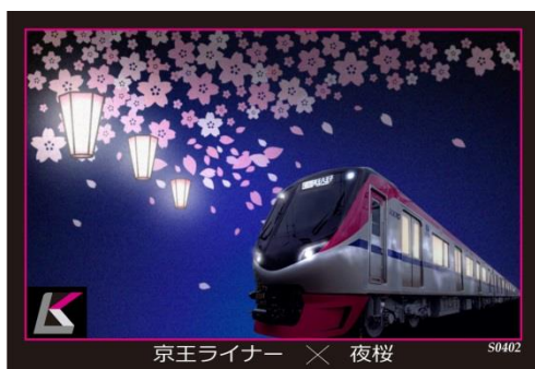
《オリジナルトレーディングカード》

※京王チケットレスサービスの優先予約サービスに登録されているお客様は、7日前の午前6時から購入できます。