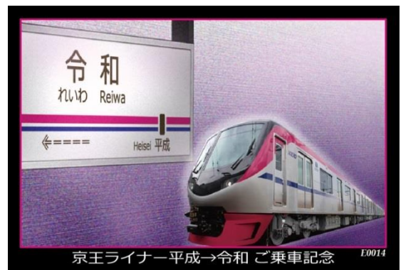
《オリジナルトレーディングカード(イメージ)》