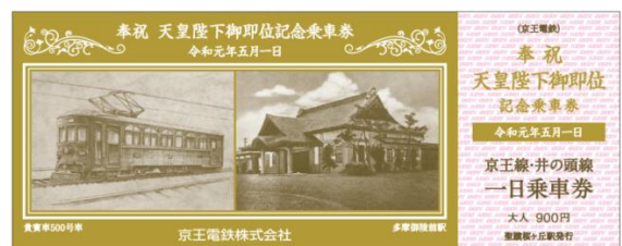
《天皇陛下御即位記念乗車券の一部（イメージ）》