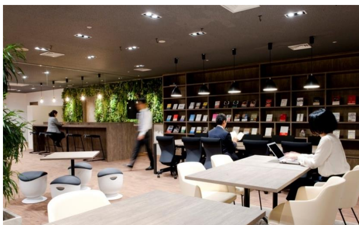
≪KEIO BIZ PLAZA≫