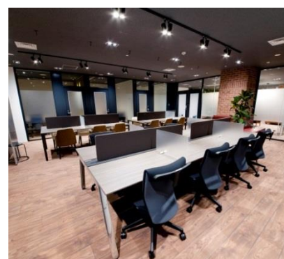
《専用ワークスペース》