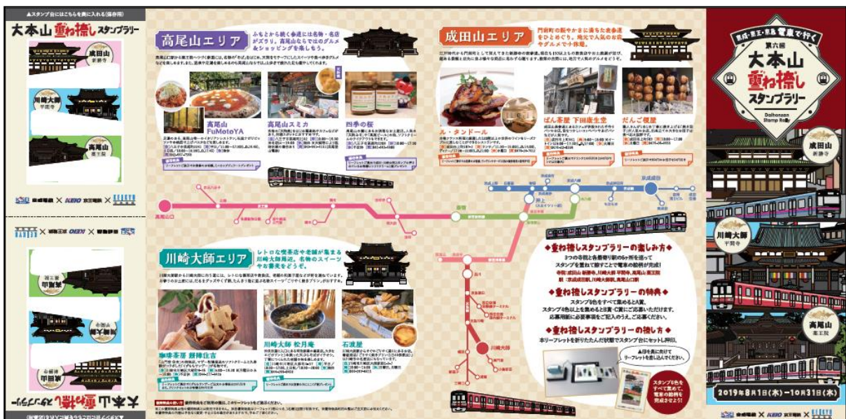
リーフレット (イメージ)

京浜急行電鉄株式会社 京急ご案内センター 電話：03-5789-8686 (平日9:00~19:00 土・日・祝9:00~17:00) ※営業時間は変更となる場合がございます。