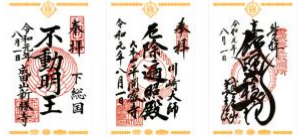
大本山重ね捺しスタンプオリジナル御朱印台紙 (イメージ)

各寺院の受付で、リーフレットをご提示いただき、御朱印料をお納めいただくと「大本山重ね捺しスタンプオリジナル御朱印台紙」に御朱印を受けることができます。