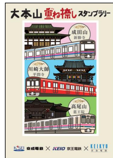
重ね捺しスタンプ（完成イメージ）