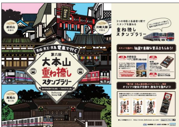
ポスター（イメージ）