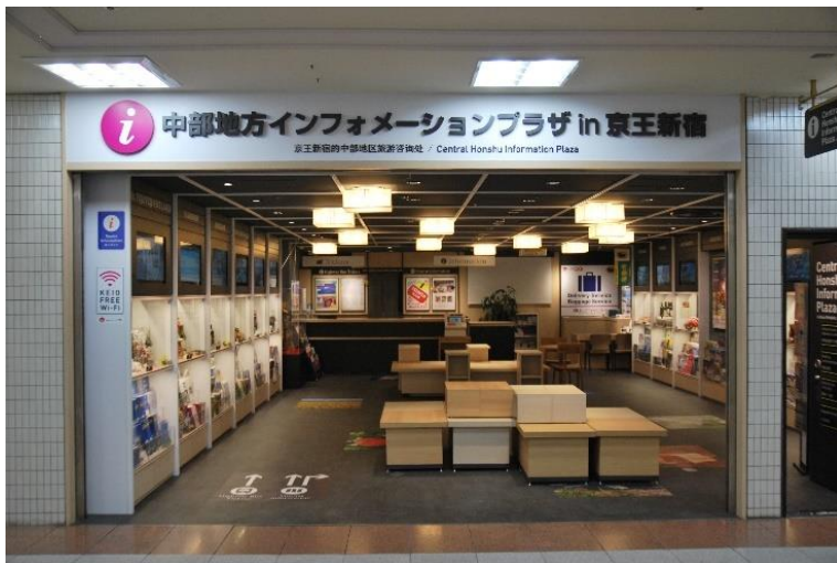
《中部地方インフォメーションプラザ in 京王新宿》