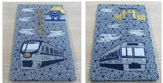
《御朱印帳 ㊤表 ㊦裏》