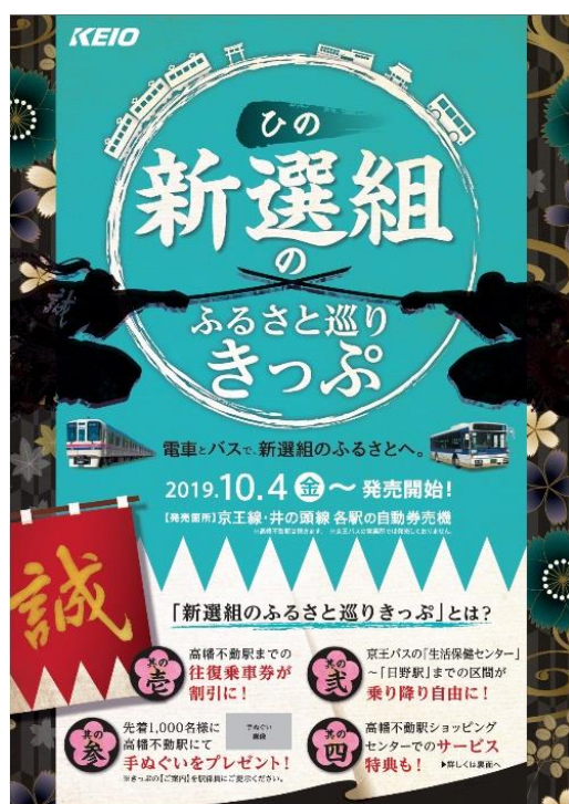
≪新選組のふるさと巡り切符PRチラシ≫