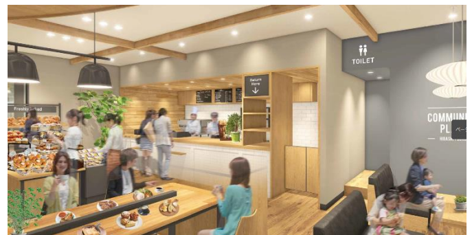
《店舗イメージ 左：店舗入口 右：店舗内》