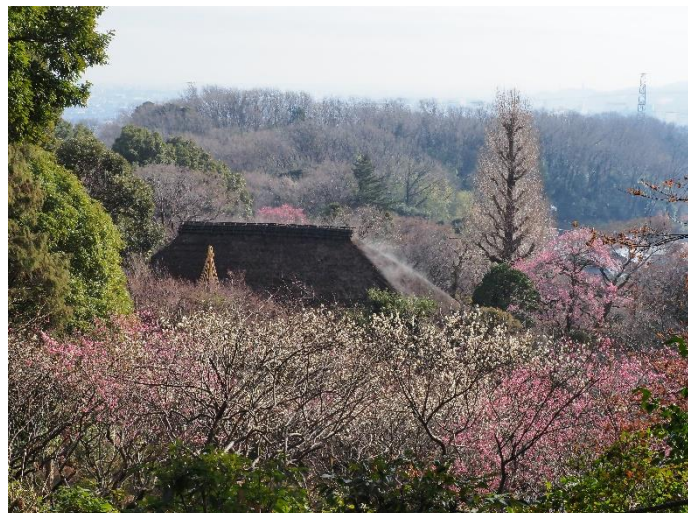
《昨年の様子 ㊤シロカガ ㊦見晴台からの眺め》