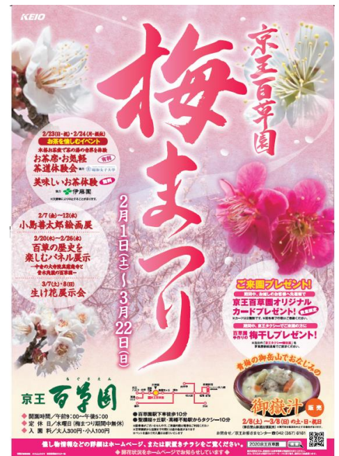
《梅まつりポスターイメージ》