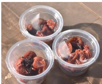
《京王百草園手作りの梅干し》