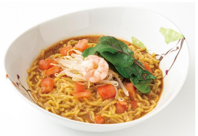
《台湾風担々麺（5月頃発売予定）》