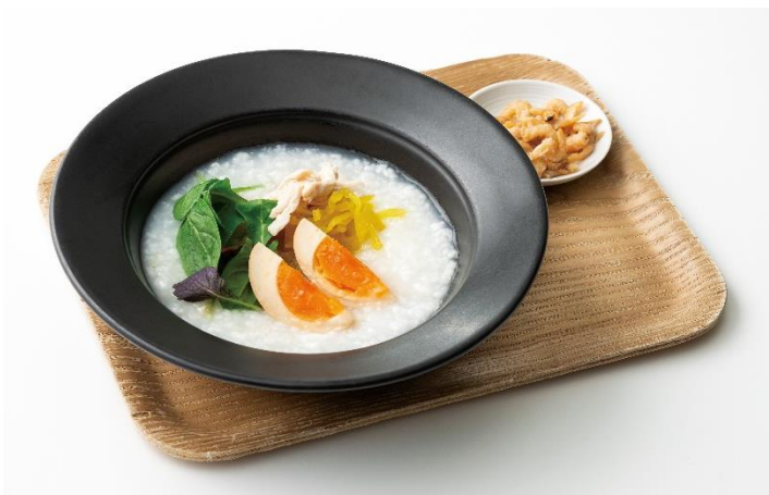
《台湾粥（定番メニュー）》