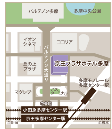
《KEIO BIZ PLAZA所在地》