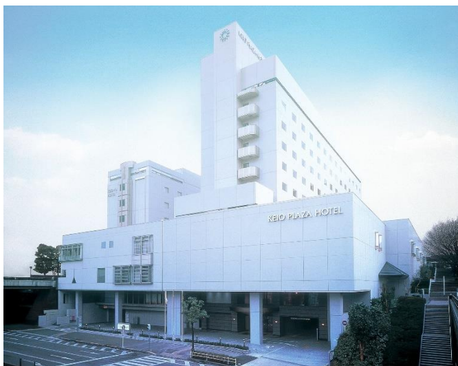
《京王プラザホテル多摩》