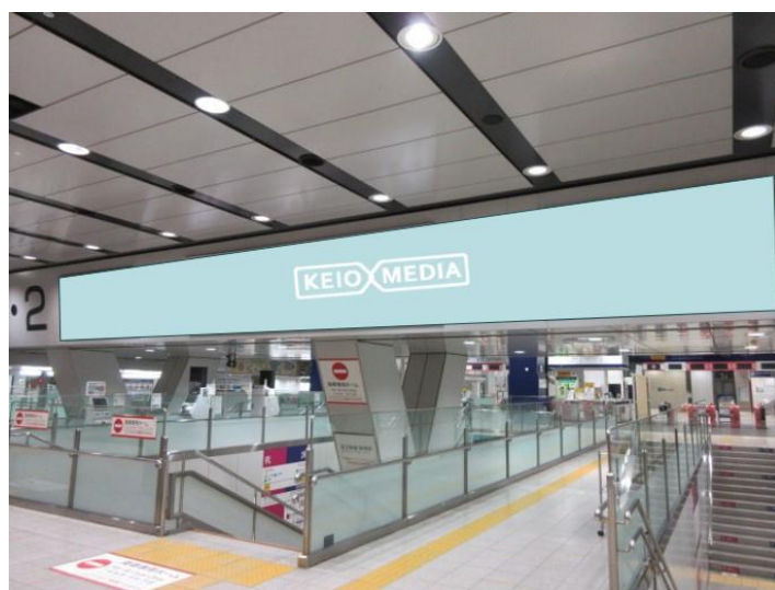
《新宿K-DGキングウォール（設置イメージ） ⑤百貨店口改札側 ⑥西口改札側》