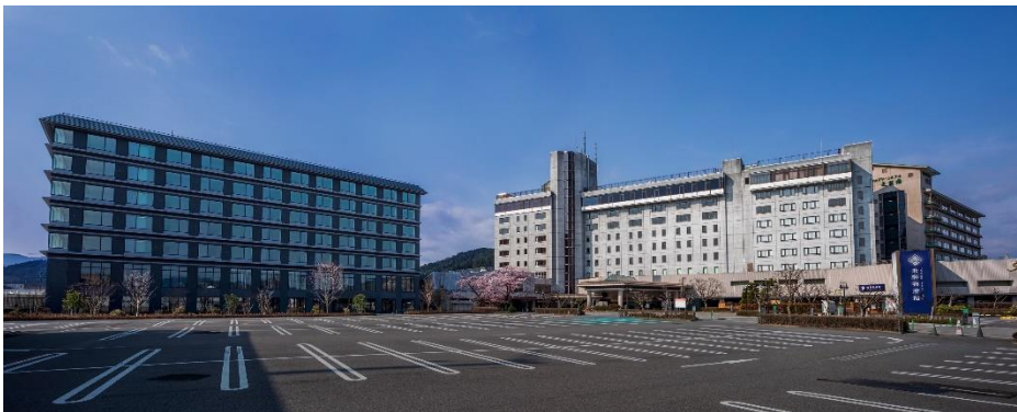
《新館「桜凜閣」外観（左の建物）》