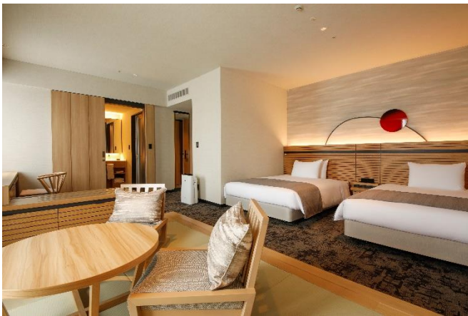
《プレミアツイン（フォース対応）》