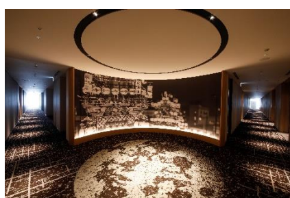
《客室階 廊下(コーナー部)》