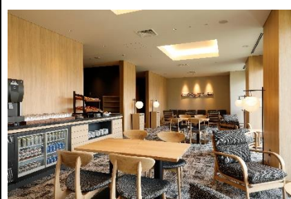
《エグゼクティブ ラウンジ》