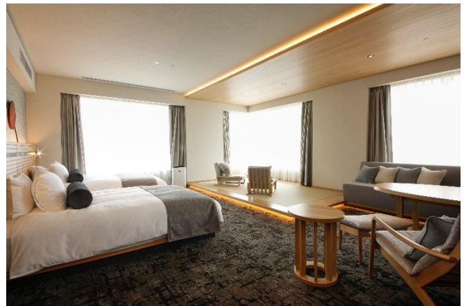
《プレミアスイート和洋室》