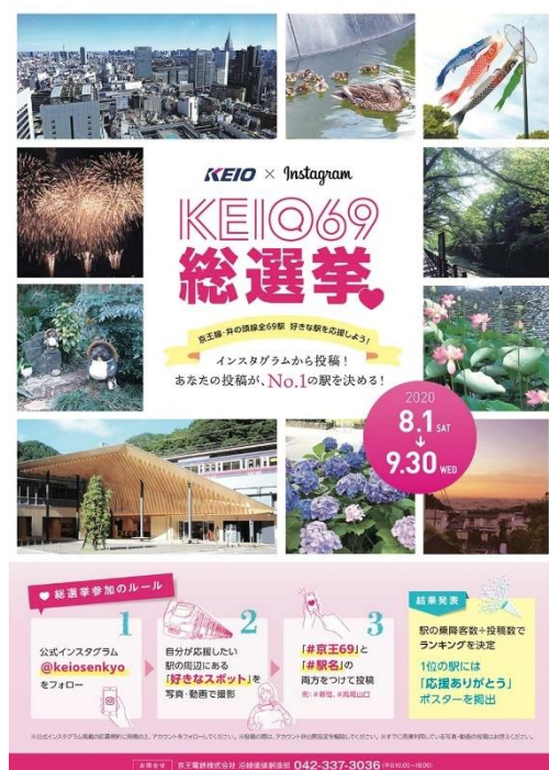
《キャンペーンポスター》