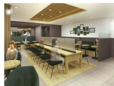
《ベーカリー&カフェ「ルパ 幡ヶ谷店」(完成イメージパース)》