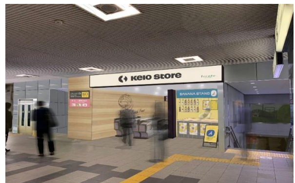
≪④仙川駅フレンテロ（イメージ）≫