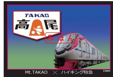
《乗車記念 トレーディングカード》

※今回配布するトレーディングカードは、通常配布しているカードのほかにMt.TAKAO号バージョンもあります(種類は選べません)