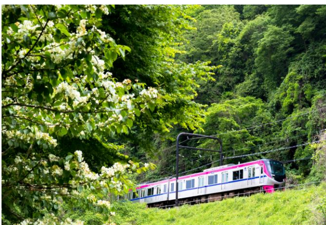
≪昨年運転されたMt. TAKAO号≫