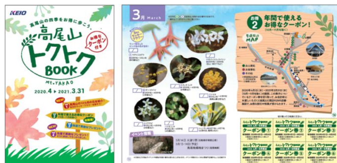
《高尾山トクトクブック》

冊子には月ごとに高尾山で見られる季節の花やイベント情報を紹介しているほか、毎月絵柄の替わるスタンプを集めると、スタンプの数に応じて抽選または先着で素敵な賞品をプレゼントします。8月7日(金)～2021年3月31日(水)(10～11月除く)の期間中、高尾山周辺のお土産処やお食事処など29店舗で利用できる、お得なクーポン券が付いており、高尾山をお得に楽しむことができます。