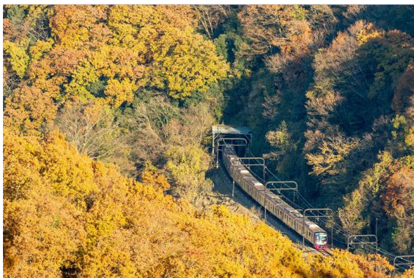
≪高尾線を走る5000系と紅葉≫