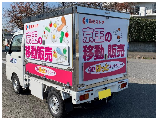
《新たに導入する移動販売車》