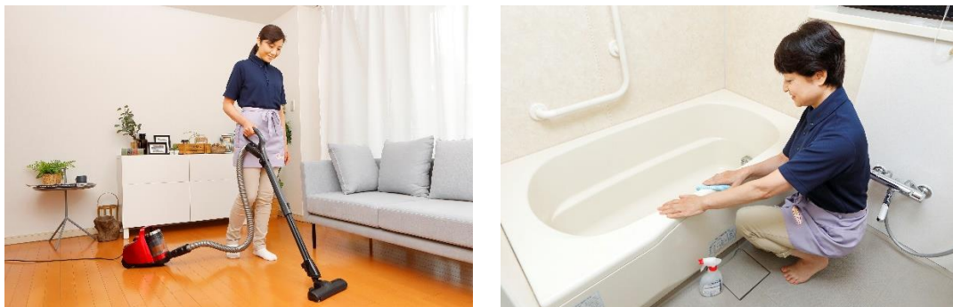
《家事代行サービス》