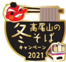
《オリジナルピンバッジ》

※チラシには掲載の各店で使える割引クーポン（500円以上のそば・うどんが100円引き）が3枚付きます。