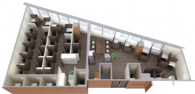
《KEIO BIZ PLAZA 府中》 （イメージ）