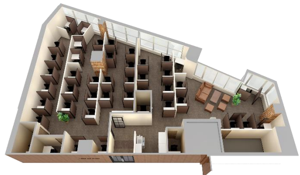
《KEIO BIZ PLAZA 京王八王子》 （イメージ）