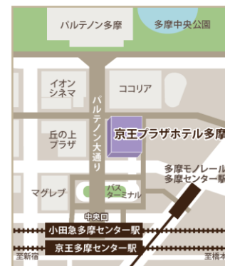
KEIO BIZ PLAZA 多摩センター所在地

8. 感染症予防について https://keio-bizplaza.jp/news/1373/