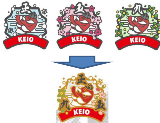
《アプリ上のデジタルバッジ (イメージ) 》