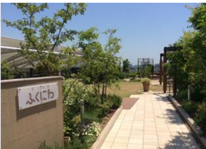
≪屋上庭園「ふくにわ」≫