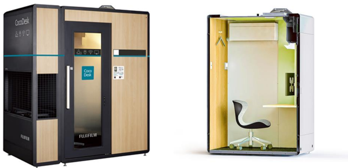
《CocoDesk》 (外観写真/室内イメージ)