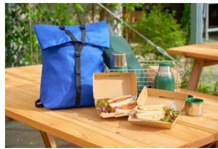
《宿泊者限定朝食セット》