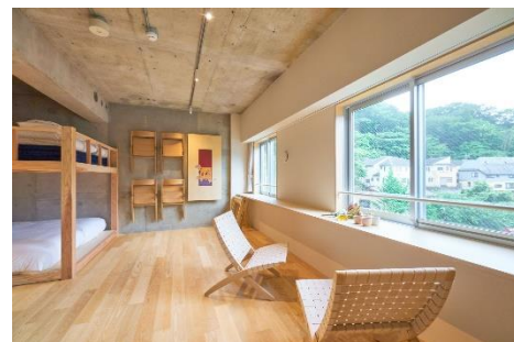
《スーペリアルーム (2段ベッド)》