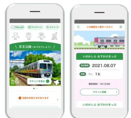
《Webチケット画面イメージ》