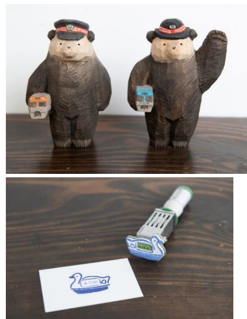
《株式会社手紙社との限定コラボグッズ》