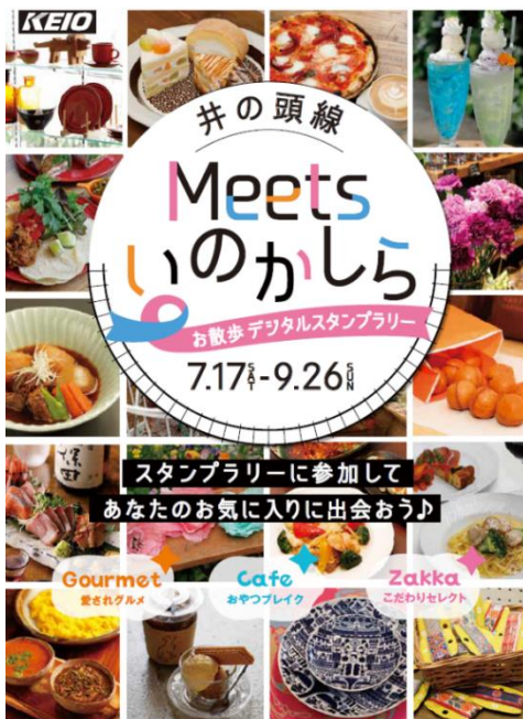
《ポスター(イメージ)》