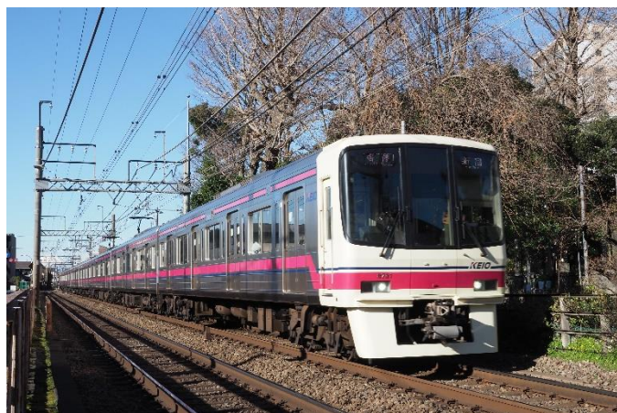
≪京王線車両イメージ≫