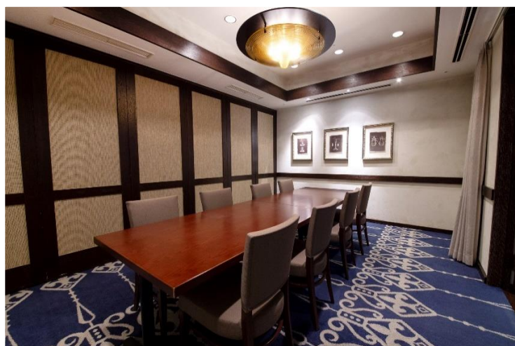
《ミーティングルーム》