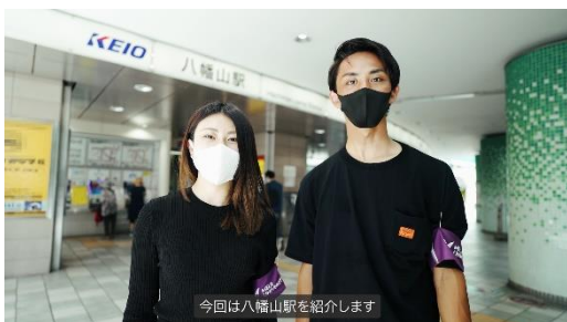
《木寺ゼミ生紹介シーン》

木寺ゼミでは、今後も地域の活性化に向けて、ひとと街を繋げる提言とその実践のための研究を進めてまいります。