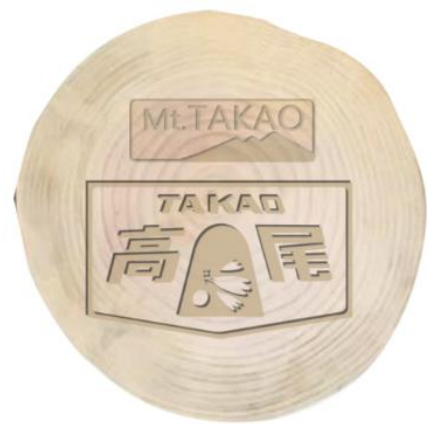
《多摩産材使用記念コースター》