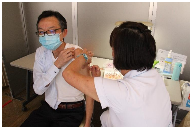
◀新型コロナウイルスワクチン職域接種の様子▶