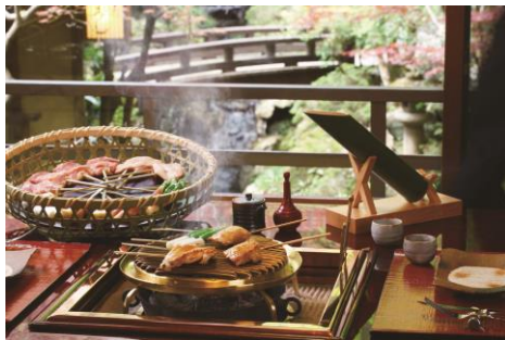
《うかい鳥山（イメージ）》