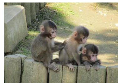
《高尾山 さる園・野草園》

(4) URL https://www.takao-monkey-park.jp/