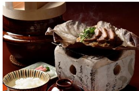
《うかい竹亭（イメージ）》