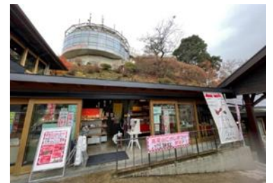
《高尾山スミカ土産処》