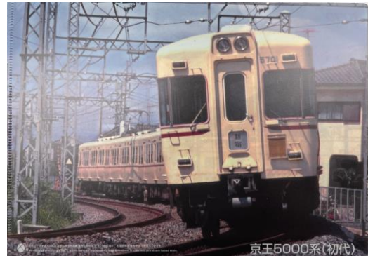
《オリジナルクリアファイル》