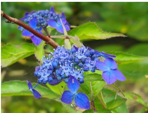
《過去のアジサイの様子》