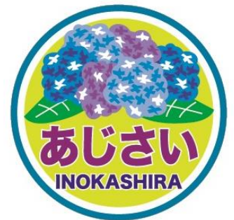
《ヘッドマークイメージ》