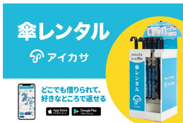
《アイカサ（イメージ）》