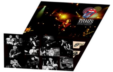
《記念乗車券三つ折り(イメージ)》