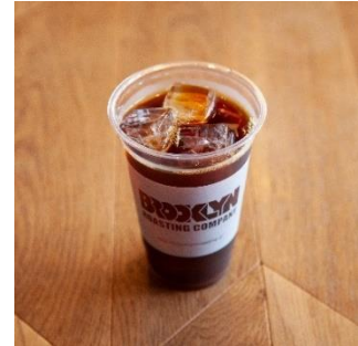
《「公式お仕事ドリンク」イメージ》