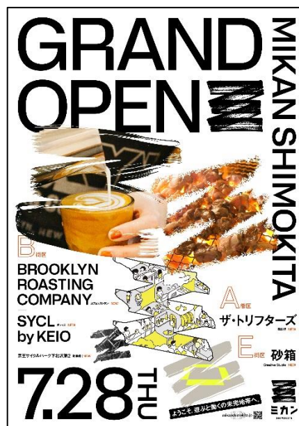
《グランドオープンポスター》