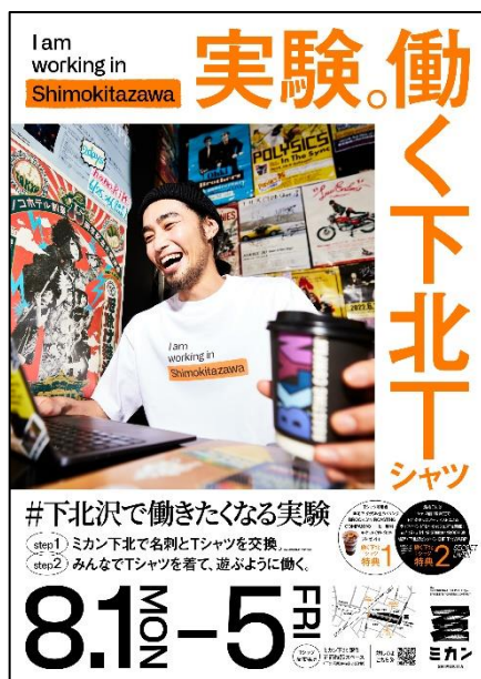
《「I am working in Shimokitazawa」ポスター》