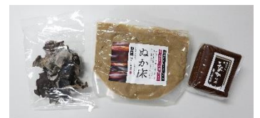
飛騨高山にある地域最大級のお土産処 飛騨物産館館長おすすめセット