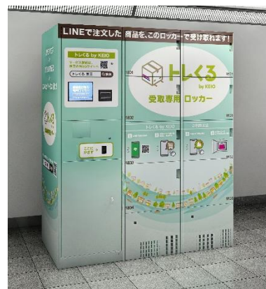
<受取専用ロッカーイメージ>