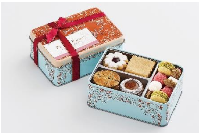
フルセック・小缶/アトリエうかい