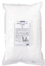
熊本県産米 (ミズホチカラ) パン用米粉