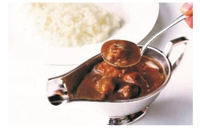
うかい亭 ビーフカレー詰め合わせ (4食入り) /うかいギフト