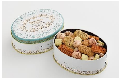
フルセック・サレ缶/アトリエうかい