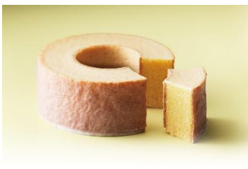
プラザバウムクーヘン