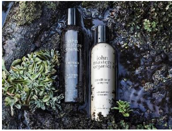
ジョンマスターオーガニック 乾燥ケア GIFT SET