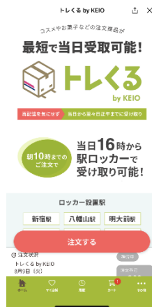
<ECモール画面イメージ>