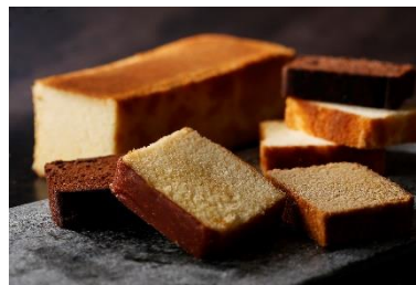
ファンシーケーキ