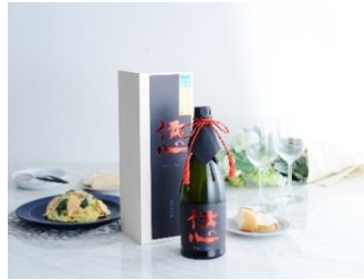
伝心 ファーストクラス 純米大吟醸 720ml