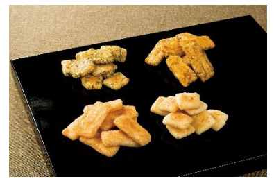
鉄板焼煎餅 4点詰め合わせ