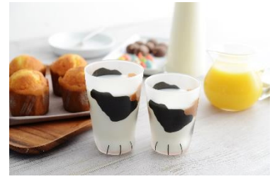
三毛猫親子のネコあしグラス セット/coconeco