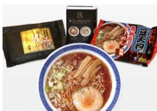
高山ラーメン食べ比べセット