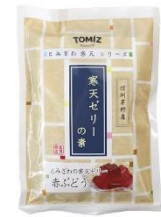
富澤寒天 ゼリーの素 (赤ぶどう)