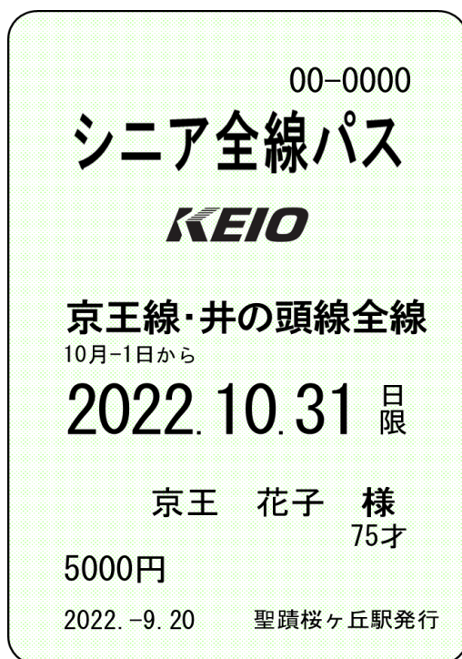
≪シニア全線パス（イメージ）≫

新型コロナウイルスの影響により、外出する機会が減少する中、京王線をご利用いただくシニア層の方々の健康促進に貢献し、地域での暮らしがより一層豊かになることを目指します。また、当企画乗車券を通じて、多くのお客様に京王線・井の頭線の様々な魅力に触れていただくとともに、回遊性の向上や、外出需要の創出を図り、沿線エリアの多面的な活性化へもつなげてまいります。詳細は下記のとおりです。