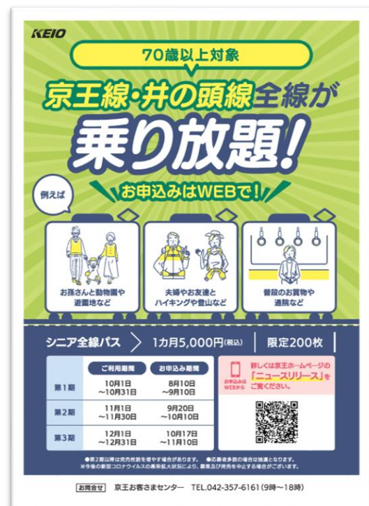
≪ポスターイメージ≫